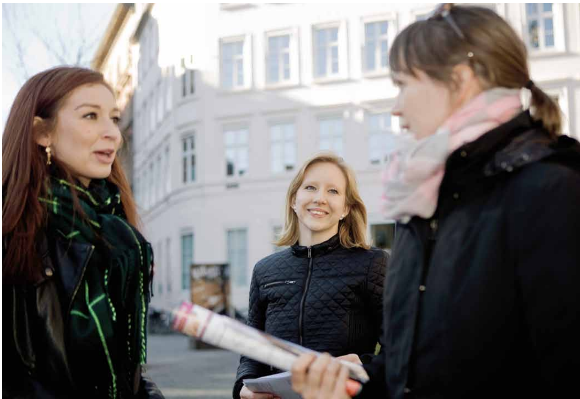
Valgkampen står lige for døren, og det betyder masser af samtaler om politik - på gaden og i vennekredsen. Vi har bedt en ekspert give tips til, hvordan du tager snakken.