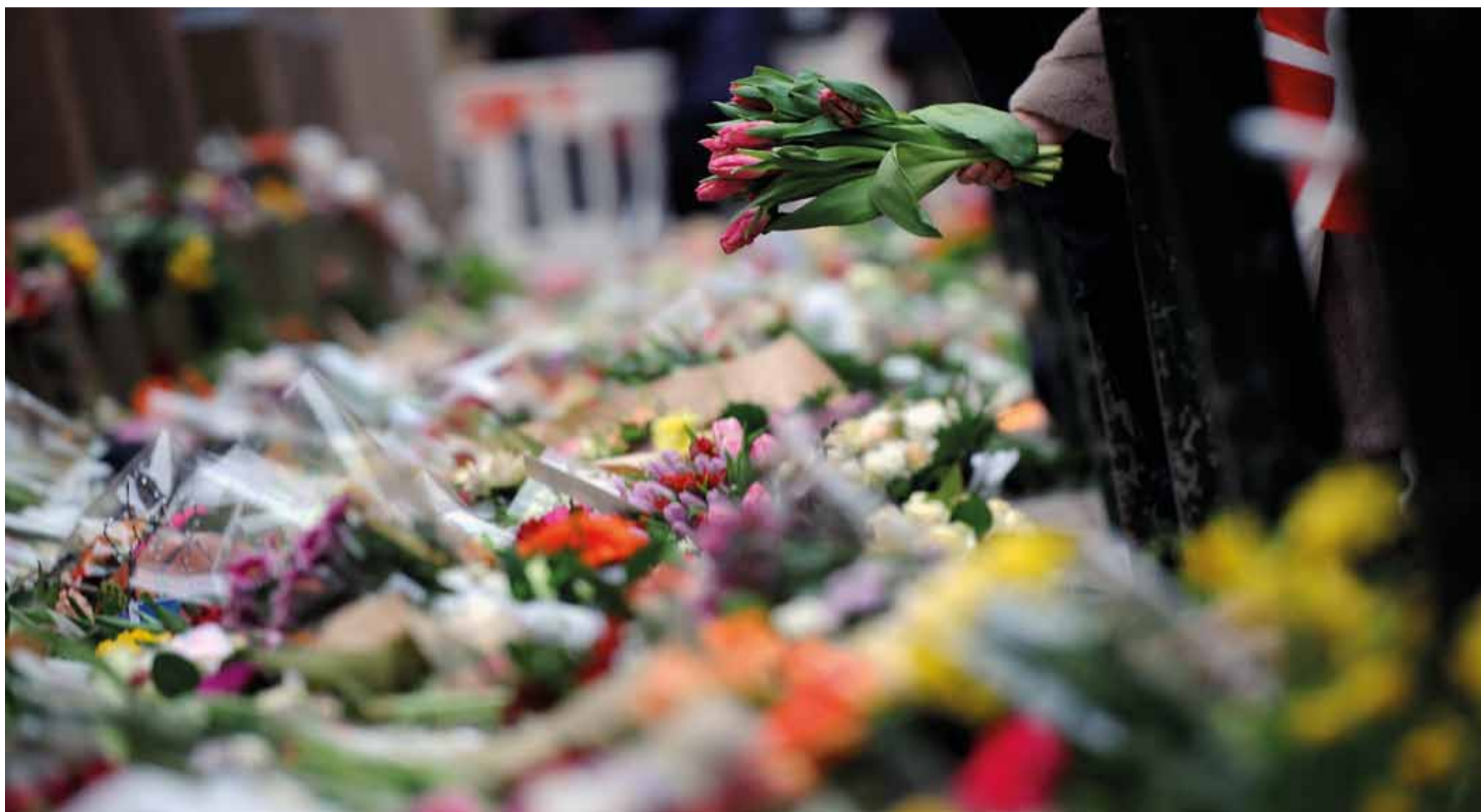
Blomster i massevis foran synagogen i Krystalgade, hvor et af terrorangrebene fandt sted natten til d. 15. februar.